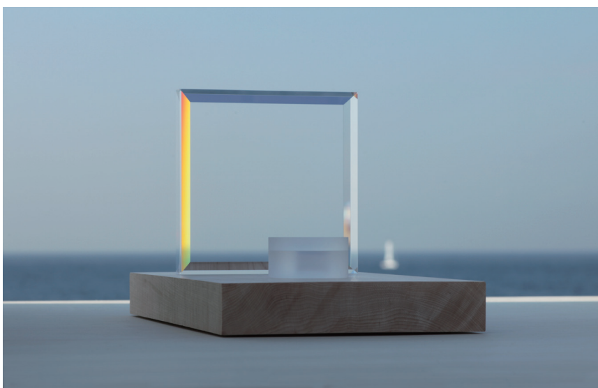
INORIGU Set [ 祈具セット ]