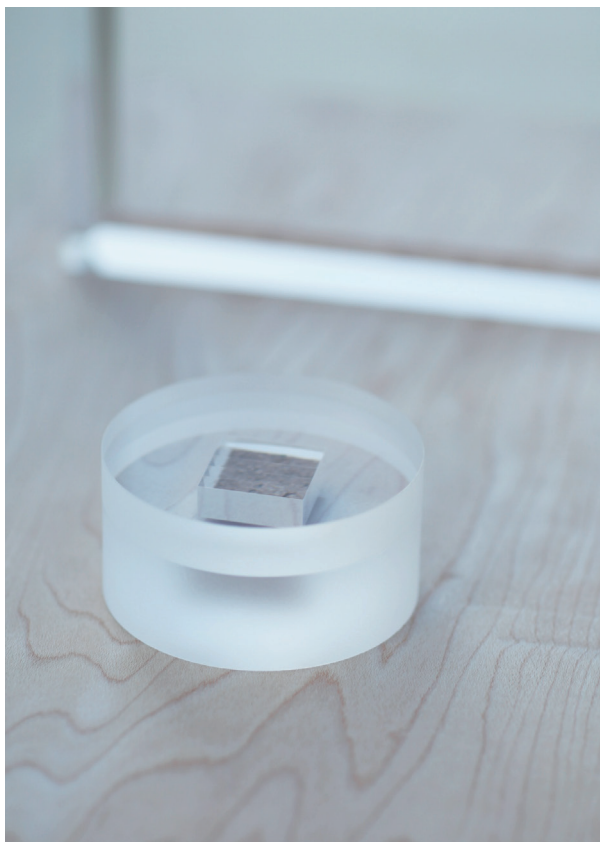
Memento Case [ 形見箱 ] : 遺灰や形見を納めるためのケース。